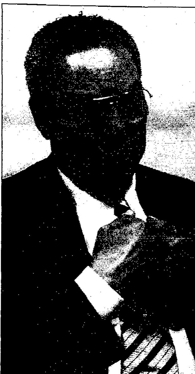
ارتداء الملايس المدنية أصبح شائعاً في مطلع السبعينات كما لا يكون للمعسكرين حضور واضح في واشنطن

بعد عدة ايام من قنوم كارلوتشي قال لي: «اريدك ان تسافر معي الى فيركوند في ألمانيا، وكان بذلك يشير الى المؤتمر السنوي الذي يعقد كل فبراير/شباط في ميونيخ بإشراف الناشر الألماني الكبير دارون فون كلايست وقد اصبح من المؤلف ان تحمل البصوت التي تلقى في هذا المؤتمر عناوين براقعة مثل: «نموذج استراتيجي جديد في أوروبا، تجل كل المهتمين بشؤون الأمن القومي يتطلعون الى حضوره».